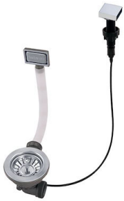
Desagüe automático - PM 8407 113