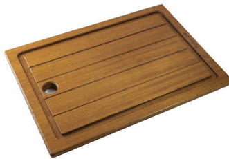
Tabla de corte de madera Iroko 8643 117